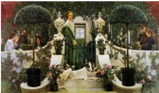
Heinrich Vogeler, Sommerabend (Das Konzert), 1905